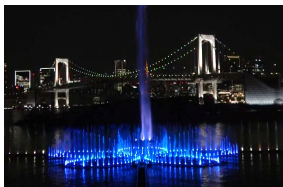
東京アクアシンフォニー