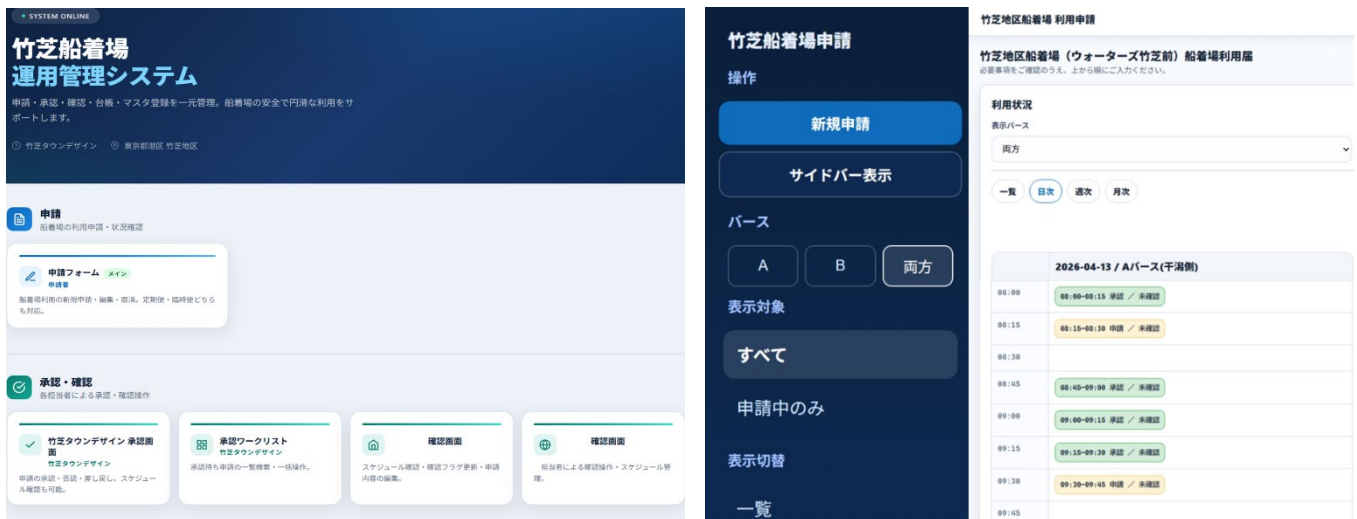
管理画面イメージ(開発時)

これらにより、竹芝地区船着場の利用承認にかかる一部業務の削減およびフローの短縮を行い、船着場を活用した自主企画の開催や、他事業者による船着場活用の促進を図ってまいります。