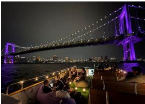
クルーズ取り組みの様子

竹芝地区では、竹芝地区船着場を舟運の拠点とするだけでなく、水辺のポテンシャルを活かし回遊・ナイトタイム等の観点から、様々なクルーズの取り組みや水辺のライトアップ等を実施し賑わい創出に取り組んできました。