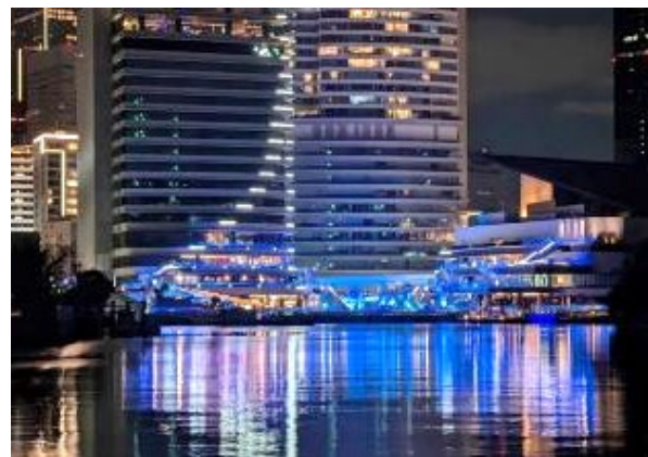
ウォーターズ竹芝のライトアップ