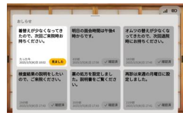
「施設スタッフからメッセージ通知」