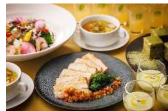
お料理の一例 (ホテルメトロポリタン 川崎)