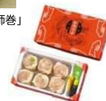
崎陽軒「昔ながらのシウマイ(6個入)」