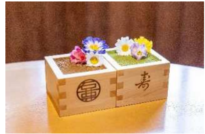
升ティラミス花盛り(抹茶/ほうじ茶)