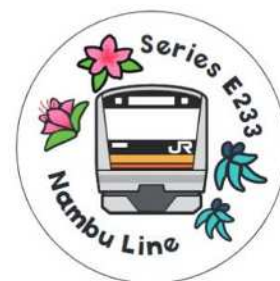
オリジナルシール

生田緑地(川崎市)、川崎市緑化センター(川崎市)、三溪園(横浜市)、山手イタリア山庭園(横浜市)、大船フラワーセンター(鎌倉市)、ヴェルニー公園(横須賀市)