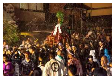
湯かけまつり(本番)の様子

【内容】 温泉街を練り歩く神輿にむかって温泉の湯を浴びせ、担ぎ手も観客も一緒になって盛り上がる「湯かけまつり」を5月23日(土)の本番に先がけ、万葉公園内で体験できる初のイベントです。