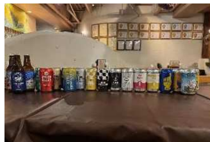
各ブルワリーのクラフトビール