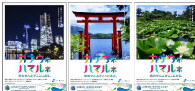
ポスター(左から、みなとみらい・箱根神社・三溪園)