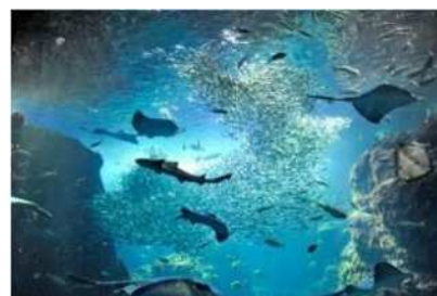
新江ノ島水族館(相模湾ゾーン)

[場所] 新江ノ島水族館(藤沢市)、川崎水族館(川崎市)、 八景島シーパラダイス(横浜市)、箱根園水族館(足柄郡箱根町)、 相模川ふれあい科学館アクアリウムさがみはら(相模原市)