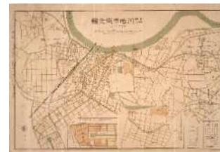
古地図(大正13年当時)