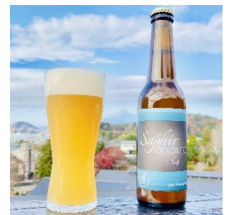
Saphir Brew ※JR 東日本商品化 許諾申請中

「サフィール踊り子」の名前の由来である「サファイヤ」を意味するフランス語と、ビールなどの醸造を意味する「Brew」を掛け合わせた商品名とし、「サフィール踊り子」を想起させるストレートな表現としました。