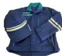
技術型こども制服