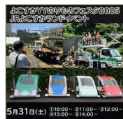
JRE MALL チケット

※JR よこすかランドに入場されるお一人さまにつき、1枚の購入が必要となります。