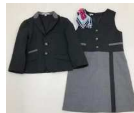
グリーンアテンダント kids 制服