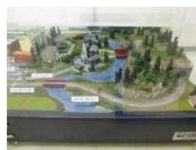
ジオラマと信号設備の展示