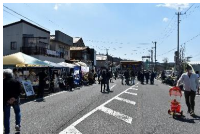
(敷島駅開業 100 周年イベント開催時)