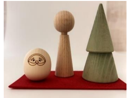
絵付け体験用の木地こけし(イメージ)