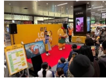
過去のぐんまちゃんグリーティング ©群馬県 ぐんまちゃん