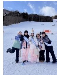
スノーQueen・オブ・ぐんま