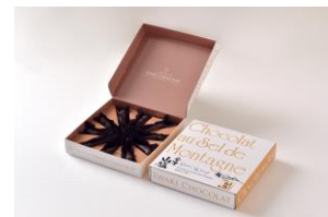
めひかり塩チョコ 会津山塩