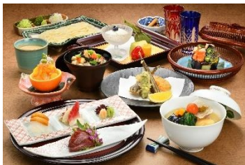
ふくしまDC月替わり会席(仙台)

ホテルメトロポリタン仙台の日本料理・鉄板焼「はや瀬」とホテルメトロポリタン山形の日本料理・鉄板焼「最上亭」では福島県の豊かな食材を使用したお料理や福島県で造られた日本酒をご提供します。