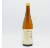
ほまれ酒造 純米吟醸 からはし夢の香