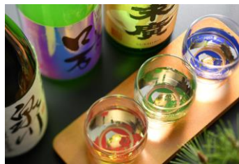
日本酒飲み比べセット