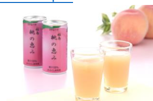
JA ふくしま未来 福島 桃の恵み (新幹線・特急列車のみ)