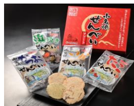
小名浜せんべいアソート