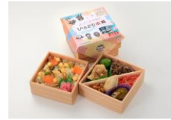
JR 東日本商品化許諾済

販売店舗:郡山駅構内福豆屋各店(エキナカスタンド福豆屋、福豆屋郡山駅店、福豆屋2号売店)、NewDays(会津若松、福島新幹線改札内、福島西口、ミニ郡山8号)、おみやげ処新白河