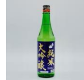
奥の松酒造 純米大吟醸 紺ラベル