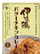
伊達鶏バターチキンカレー

開催場所：グランスタ店(八重洲北口改札内)、グランスタ丸の内店、エキュート上野店