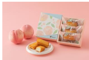
ふくしま桃のフィナンシェ3個入り