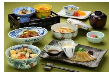
福島味巡り膳(山形)