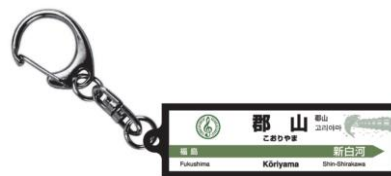
駅名標キーホルダー JR 東日本商品化許諾済