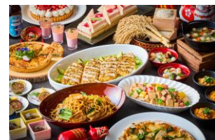
オールデイダイニング 「クロスデザイン」メニュー