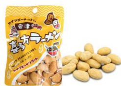
アイズピーナつまみ 喜多方ラーメン

https://www.jresc.co.jp/pdf/service/coffee.pdf