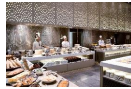
ダイニング・カフェ 「ベルテンポ」