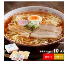
河京喜多方ラーメン 10食(お得用)