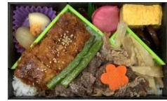
JR 東日本商品化許諾済

販売店舗:郡山駅構内福豆屋各店(エキナカスタンド福豆屋、福豆屋郡山駅店、福豆屋2号売店、NewDays(会津若松、福島新幹線改札内、福島西口、ミニ郡山8号)、おみやげ処新白河