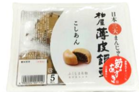
柏屋薄皮饅頭 こしあん 5個入