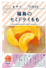
福島のセミドライもも 10個