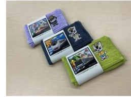
JR 東日本商品化許諾済