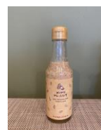
ピーナッツドレッシング