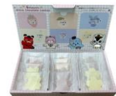
JR 東日本商品化許諾済