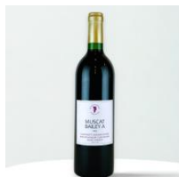
マスカットベリーーA