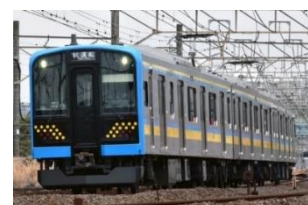
【鶴見線 E131 系】