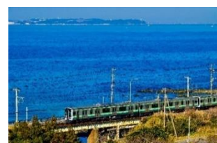
【内房線 E131 系】