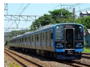
【相模線 E131 系】