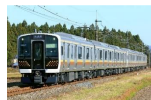
【宇都宮線・日光線 E131 系】