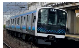
【仙石線 E131 系】