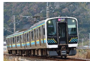
【外房線 E131 系】