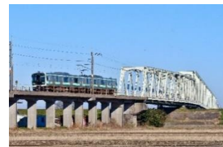
【成田線・鹿島線 E131 系】