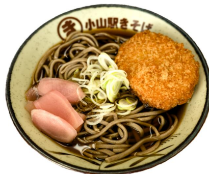
コロッケ新生姜そば