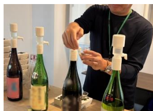
月替わりで楽しむ 栃木の地酒