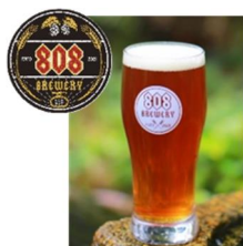
クラフト生ビール (808 ブルワリー他)