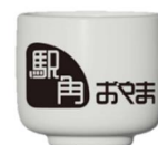
駅角おやまロゴ入りおちょこ

開催期間中にご来場いただき、飲食又は商品をご購入された方にスタンプカードをお渡しします。ご利用 1 回につき 1 ポイント付与し、3 ポイント集めると「駅角おやまロゴ入りおちょこ」をプレゼントします。 ※スタンプ付与は 1 日につき 1 ポイントまでとなります。