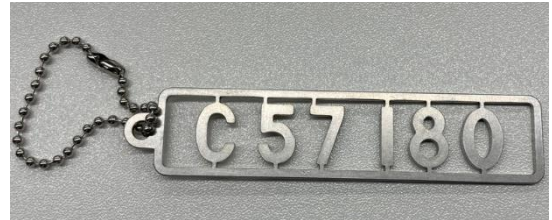
ナンバープレート型キーホルダー (95mm×20mm 金属製 ※チェーン除く)