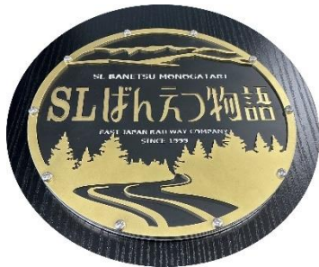
ヘッドマークレプリカ (直径約 200mm 重量約 4kg 金属製)

「SLばんえつ物語」が装着したヘッドマークのレプリカと、ナンバープレート型キーホルダーをご用意します。