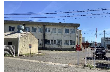
新津乗務室 正面入り口