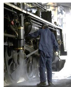
SLの出区点検の様子