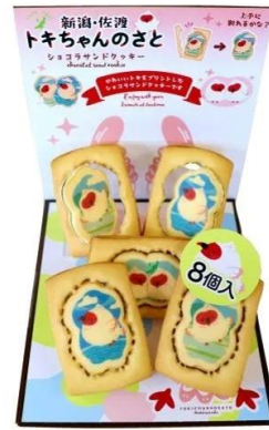
新潟・佐渡トキちゃんのさと

佐渡バターと佐渡海洋深層水塩を使用した昔ながらの釜揚げ製法で丁寧に揚げたじゃがいも本来の風味が引き立つ素朴で懐かしい味わいです。