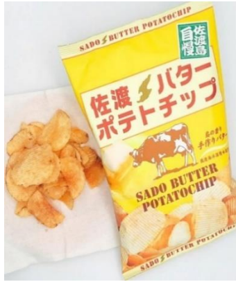
佐渡バターポテトチップ

佐渡バターと佐渡海洋深層水塩を使用した昔ながらの釜揚げ製法で丁寧に揚げたじゃがいも本来の風味が引き立つ素朴で懐かしい味わいです。