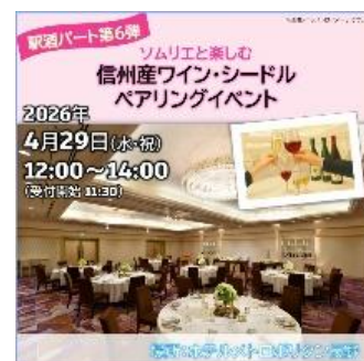
商品ページ（イメージ）

※ワイン・シードルの提供は60ml ずつとなります。なお、銘柄は変更となる場合があります。 ※イルフェボーの提供ワインはいずれか1種のみ提供となります。