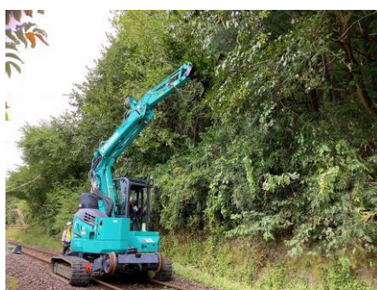
樹木伐採及び除草