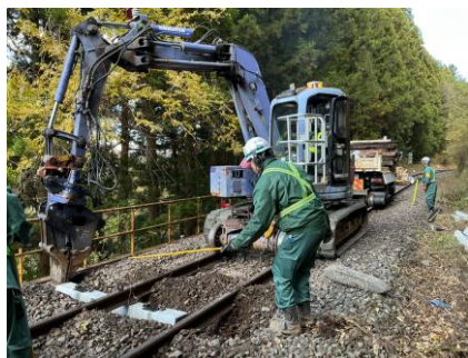
マクラギ交換（木製→コンクリート製）