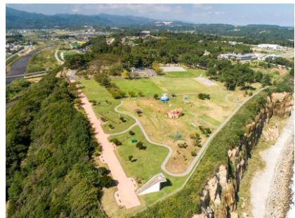
③檜葉エリア (天神岬)