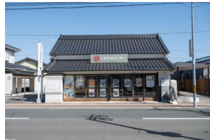
①小高エリア (小高交流センター)