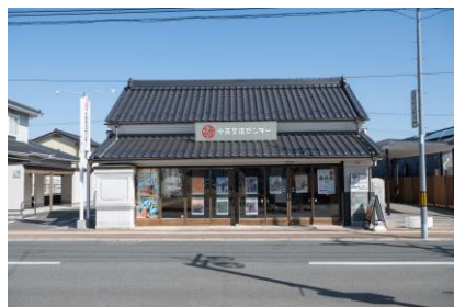
①小高エリア (小高交流センター)