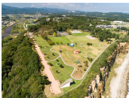
③檜葉エリア (天神岬)