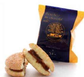
めひかり塩チョコブッセ