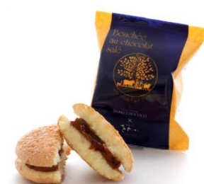
めひかり塩チョコブッセ