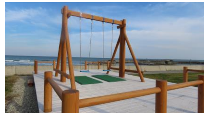
②富岡エリア (富岡漁港ぶらんこ広場)