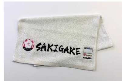
オリジナルタオル