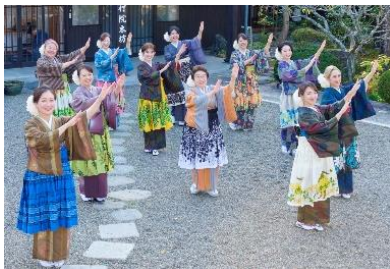
いわき湯本温泉のフラ女将