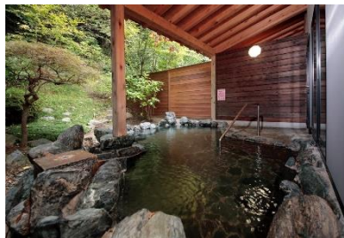
旅館こいと・露天風呂