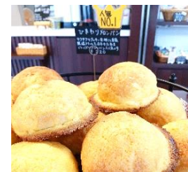
▲パン各種 (ひまわりぱん)