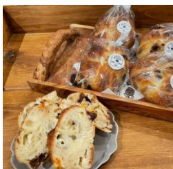
▲パン各種 (Michiru Bakery)