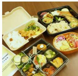
▲地域おこし弁当 (茨城県立大子清流高等学校)