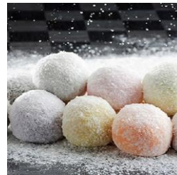
▲久慈川の水華餅 (株)菓匠宮川