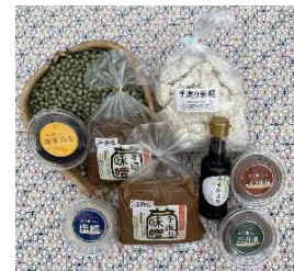
▲味噌各種 (糀や 菊池商店)