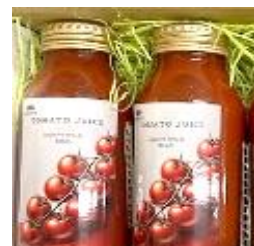
▲トマトジュース (常陸太陽の庭)