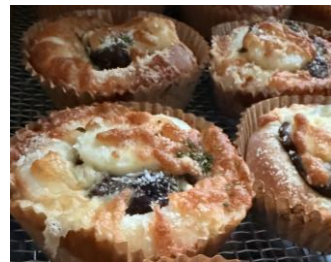
▲奥久慈卵の カレーチーズパン MichiruBakery