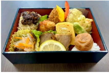
▲風っこ乗車記念掛け紙付 オリジナル茨城づくし弁当 おにぎり山翠（水戸市）