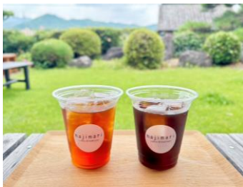
▲アイスコーヒー（250ml） （浅煎り、深煎り2種） hajimari