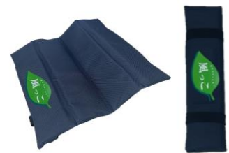
▲風っこ号オリジナルアウトドアクッション

https://event.jreast.co.jp/shop/detail/a007