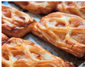
▲大子町産りんご使用 アップルパイ MichiruBakery