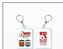
【電車キーホルダー】