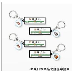
【駅名標キーホルダー】