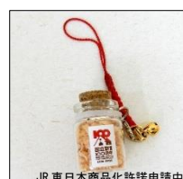
【国立駅旧駅舎古材おが屑】