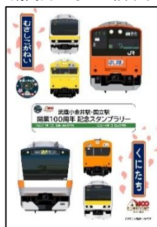
賞品(クリアファイル)