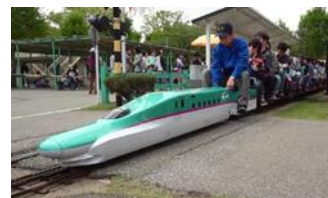
JR東日本商品化許諾済