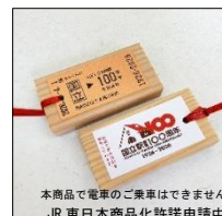
【国立駅旧駅舎古材きつぷ】