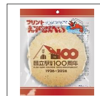
【国立駅開業100周年プリント えびせんべい】