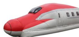
JR東日本商品化許諾済