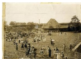
1926年開業時の国立駅