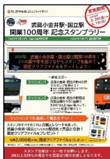
ポスター(イメージ)