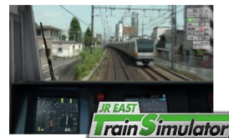
シミュレータイメージ

※JRE MALL にて完売しなかった場合、当日の10:00より旧国立駅舎展示室にて整理券を配布し受付を行います。その場合の支払い方法はSuica等交通系ICカード決済のみです