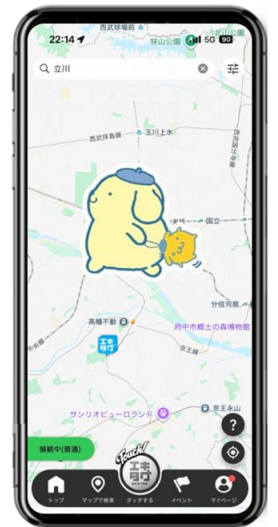
ポムポムプリンパレーダーイメージ