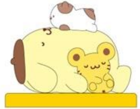
巨大バルーンイメージ