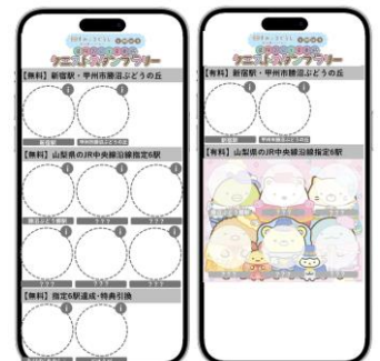
無料コース シートイメージ 有料コース シートイメージ