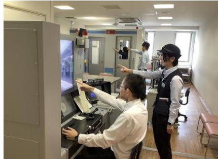
【運転士・車掌シミュレータ連動の様子】