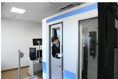
【ドア開閉操作体験】