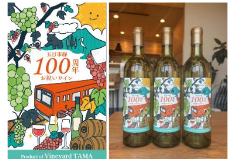
【オリジナルラベル】