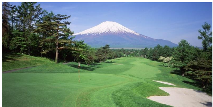
富士ゴルフコース（イメージ）