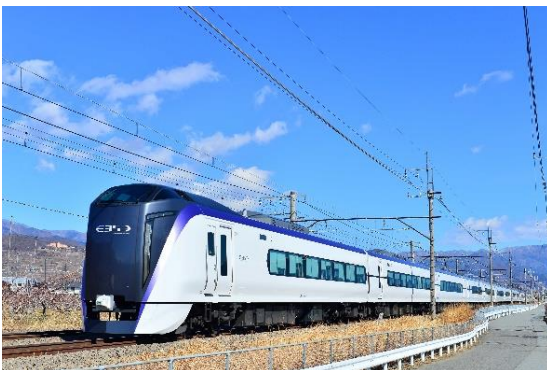
特急「富士回遊」（イメージ）