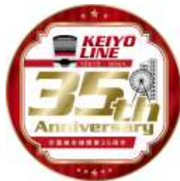
デザインイメージ