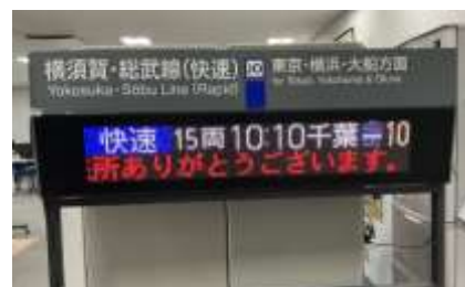
模擬 LED 発車標イメージ

本物さながらの LED 発車標に、好きな列車や文字などを表示させることができます。Suica チャージキャンペーンにご参加いただき、蘇我駅の券売機において、10,000 円以上のチャージをしていただいた方が対象です。 ※券売機で領収書を発行しお持ちください。