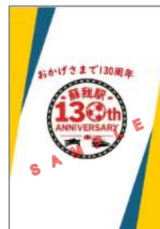
記念クリアファイル

蘇我駅の券売機でお持ちの Suica に 5,000 円以上チャージをしていただくと、Suica のペンギンのメモ帳と蘇我駅 130 周年の記念クリアファイルをプレゼントします。 ※券売機で領収書を発行しお持ちください。