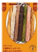
生チョコス専門店 CHURRORU