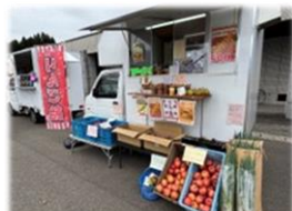
株式会社 翠久の里