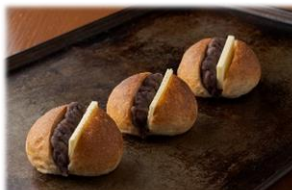
亀の町ベーカリー