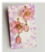
手づくり雑貨 華花