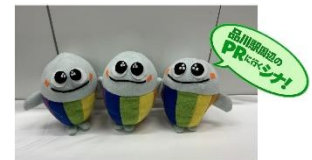
品川駅オリジナルキャラクター【しなくいら】

アンケートにお答えいただくと、粗品をプレゼント。ぜひお気軽にお立ち寄りください。