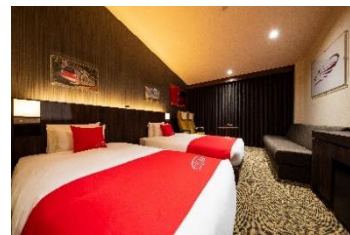
【E6 系こまちルームイメージ】