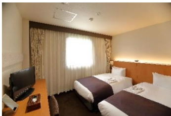
【ツインルームイメージ】