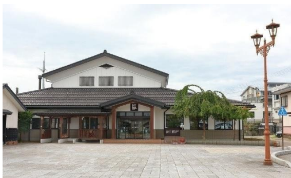
【ホテル外観イメージ】