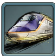
プレイヤーアイコン