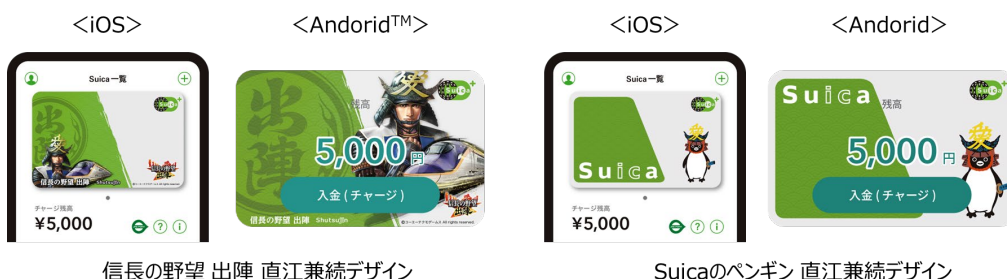
信長の野望 出陣 直江兼続デザイン

https://www.jrepoint.jp/campaign/0061002010/