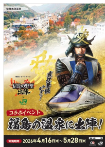
オリジナルポスター

現地の温泉協会ですら引換可能な、オリジナル手ぬぐいを、各箇所ですら先着 300 名様にプレゼントします。引換には、ゲーム内の期間限定ミッションで各温泉への訪問を達成し、引換箇所でのアプリ画面の提示が条件となります。 ※デザインは、各温泉協会ですら同じものとなります。