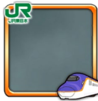
プレイヤーフレーム