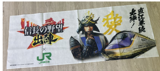
オリジナル手ぬぐい