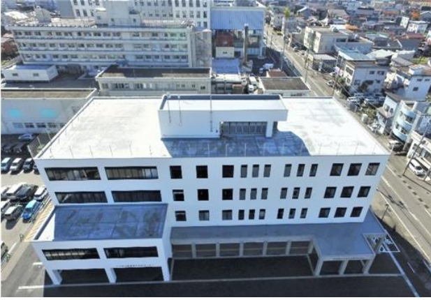
十日町市医療福祉総合センター