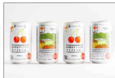
共創企画による地域産品の高付加価値化