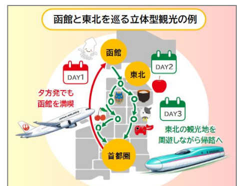
立体型観光のイメージ