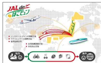
JAL de はこビュンの展開