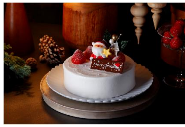
<キービジュアル/展開メニュー一例>