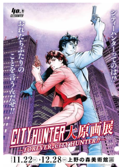
▲原画展キービジュアル

https://event.jreast.co.jp/activity/detail/a075/a075-00012