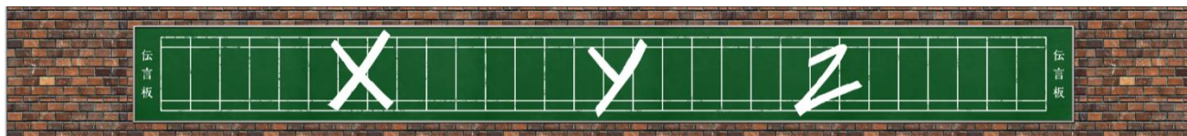
▲告知映像イメージ

特設ページ： https://event.jreast.co.jp/pages/cityhunter40th_mobilesuica