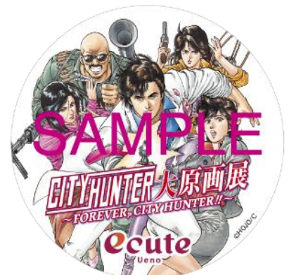
▲ステッカーデザイン