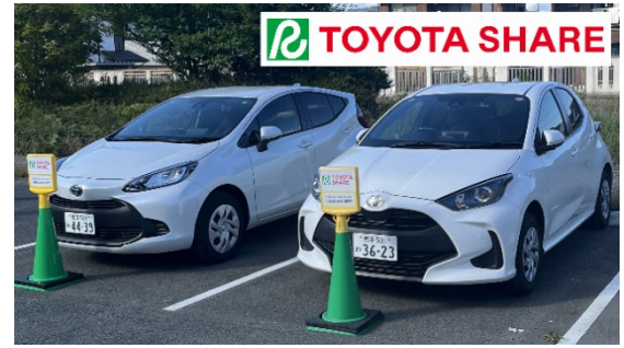
実証実験に使用する車両のイメージ (運用の都合で変更になる可能性があります)