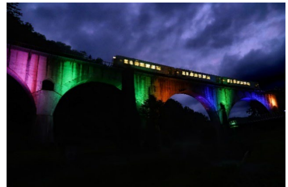
遠野市近郊の観光地 (めがね橋)