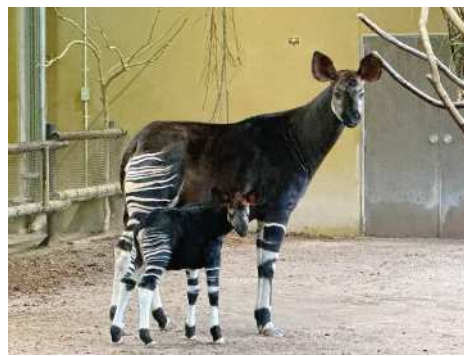
オカピの親子 (2024年7月30日生まれ、9月3日撮影)