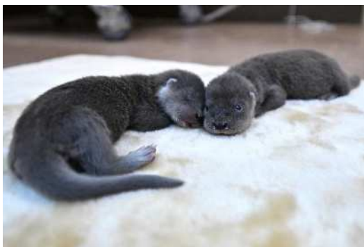
カワウソの赤ちゃん (2024年8月11日生まれ、9月4日撮影)

横浜線 中山駅からバスでアクセスできるズーラシアでは、元気な動物の赤ちゃんが続々誕生しています！ぜひ、親子で「よこはません どうぶつクイズラリー」に参加して、さまざまな動物たちに会いにいってみませんか？