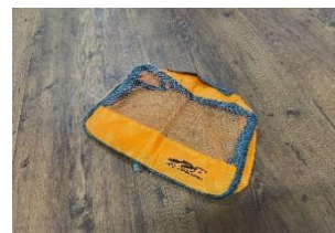
ノベルティグッズ一例 (トラベル収納ケース)

秋田県を重点販売地域として観光キャンペーンを展開する期間に、この観光 PRで配付するパンフレットに同封のオリジナルポストカードを秋田駅みどりの窓口隣にある「駅たびコンシェルジュ秋田」にて提示すると、先着 100 名さまにオリジナルノベルティグッズをプレゼントします。