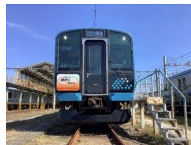
2023年に運行した「時めく Train」の様子