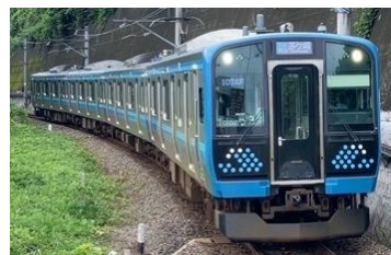
205 系と E131 系をモチーフにしたカプセルトイ

※参加費及び「相模の大風センター」への入館料は無料ですが、移動に必要な交通費およびスマートフォン等の通信料はお客様負担となります。