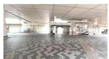
降りて左側に進む