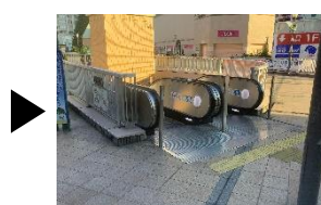
エスカレーターを下る