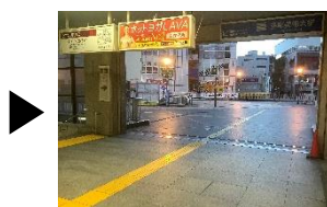
ペDESTリアンデッキに出る