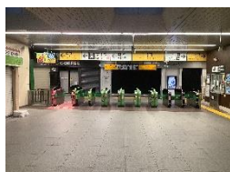
JR 橋本駅改札を右へ