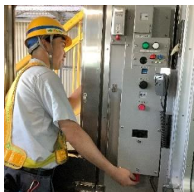
④乗務員室でのドア開閉操作試験