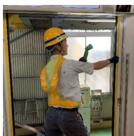
⑤客室でのドア点検