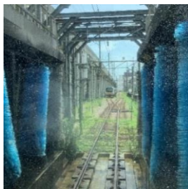
車両洗浄装置の通過体験

※電車を動かすことはできません。あらかじめご了承ください。 ※天候等状況により一部内容を変更させていただく場合がございますのでご了承ください。 ※写真はイメージです。