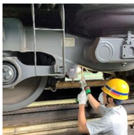
①ブレーキ装置の点検作業見学