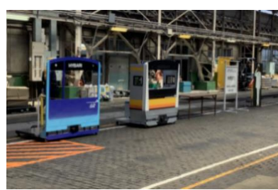
③パネルで記念撮影