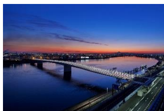
【多摩川スカイブリッジ】

川崎市（かわさきし）は、高度なものづくり技術や最先端産業、研究開発機関が集積する国際都市であることに加え、豊かな自然に恵まれ、街中に音楽や芸術があふれ、スポーツが盛んな元気都市であり、子どもたちや若者をはじめ、誰もが笑顔になれる「最幸のまち かわさき」を目指し、さまざまな取組を進めています。このような本市を「ぜひ応援したい!」と思ってください、本市出身の方や本市の施策にご賛同くださる皆さまの想いを「ふるさと納税」にのせ、本市を応援いただければと思います。寄附していただいた方へは、「川崎の魅力」を「観る」、「体験する」、「味わう」ことで、川崎らしさを体感できる機会を用意させていただいております。「川崎にはこんなにいいものがあるんだ!」と再発見してみてください。