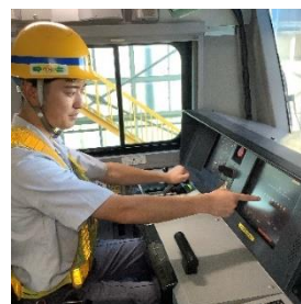
⑥運転台にてブレーキの動作確認