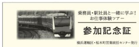
オリジナル参加記念硬券（表面）

ご参加いただいた皆さまに、「オリジナル参加記念硬券（台紙付き）」をプレゼントします。返礼品ツアーの当日、台紙には横浜運輸区と磯子駅のスタンプでスタンプを押印します。