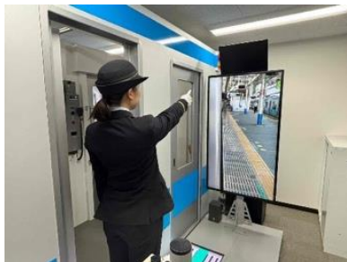
車掌シミュレータ