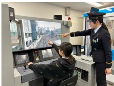
運転士シミュレータ