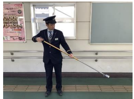
落とし物拾得作業