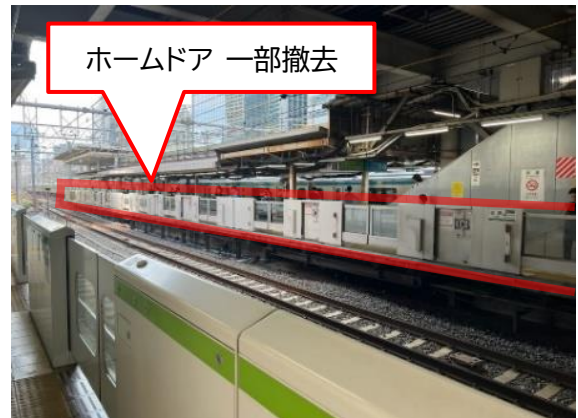
山手線外回りホーム現地状況

※撤去・再設置の詳細については、駅のポスター等でお知らせします。なお、撤去期間中は警備員を配置します。