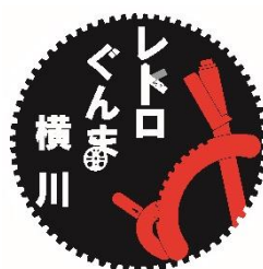
EL・DLレトロぐんま横川ヘッドマーク