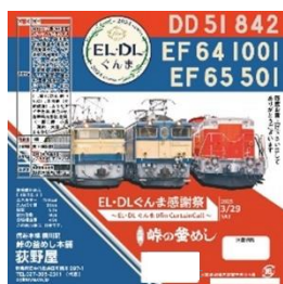
限定オリジナル掛け紙