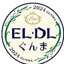
EL・DLぐんま fin 限定ヘッドマーク

EL・DLぐんま fin 限定ヘッドマークデザイン等の缶バッジをお一人さまひとつ無料で作成できます。