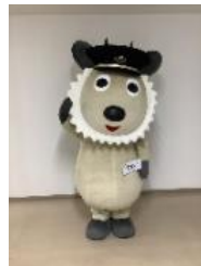
Shim Maebashi Train crew depot.