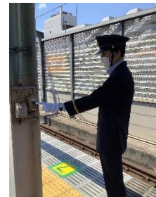
車掌体験イメージ