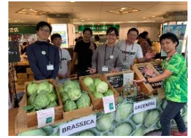
イベントイメージ

地ビールを製造する有限会社浅間高原麦酒のキッチンカーが出店します。また、「孺恋高原ブルワリー」より、キャベツ料理やクラフトビールなどを提供します。