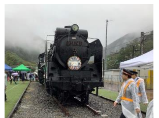
オリジナルヘッドマーク掲出