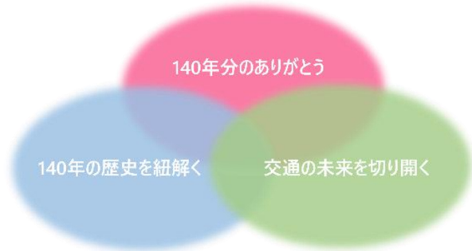
140 周年イベントのコンセプト