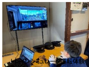
トレインシミュレータ運転体験