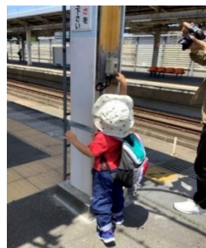
発車ベル&出発指示合図体験