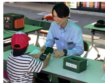
車掌のお仕事体験コーナー

車掌が使用しているスタンパーやきっぷを発券する機械(POS)を使用しての業務体験、行先表示器などの鉄道機器の展示も行います。