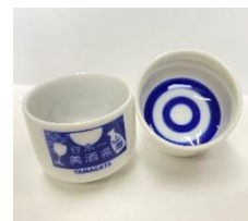
「日本一美酒県 山形」 オリジナルおちよこ