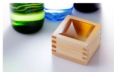
「吟醸王国」山形の日本酒