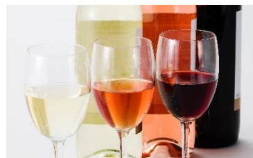
ぶどう栽培が盛んな山形のワイン