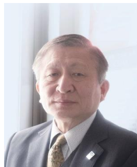
山形県酒造組合 小関特別顧問

④そ の 他 ・トークショーは各回、定員20名となります。 ・未成年の方、運転される方への試飲提供はできません。