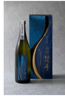
純米大吟醸 「山形讃香」

※「2023 アルケイディア セレクトハーベスト シャルドネ」は、日本国内トップクラスの生産量を誇る高畠町のシャルドネの中から特に厳選して造った高畠ワイナリーのフラッグシップワイン。あふれる果実の風味と新樽のトースト香が融合したリッチな香り。熟したブドウを連想する濃厚な果実味としなやかな質感。豊富なミネラルを感じ上品で奥深く、エレガントなスタイルの一本。