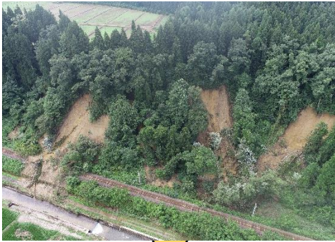
泉田～羽前豊里駅間 土砂流入