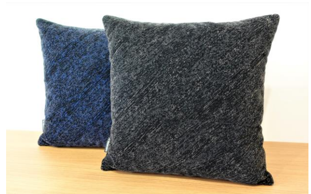
鉄道クッション（2種類） （セレーナ BU-B/セレーナ BR-B）