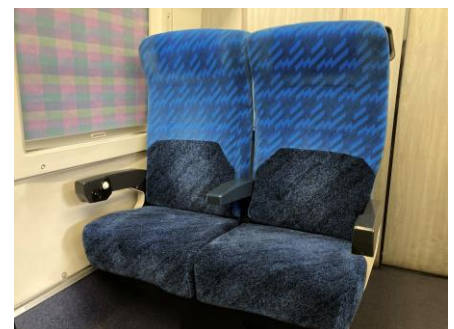
E3系1000番代 普通車 内観 （座面部シート：セレーナ BU-B）