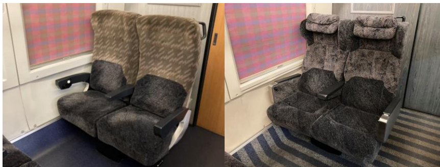
E3系1000番代 普通車/グリーン車 内観 （座面部シート：セレーナ BR-B）