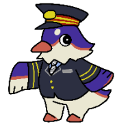
JR東日本山形エリア マスコットキャラクター「つどりい」

※上野駅での「山形産直市」以外にも、「はこビュン」を活用した旬の山形県産さくらんぼ輸送・首都圏駅での販売を予定しております。 詳細は追ってお知らせします。