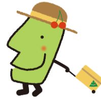
山形県おもてなし局長 「きてけろくん」