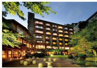
「ほほえみの宿 滝の湯」