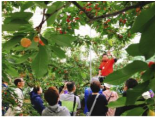
「朝摘みさくらんぼ狩り」体験