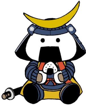
仙台・宮城観光PRキャラクター 「むすび丸」

特設ブースを設置し、観光やふるさと納税など宮城県の情報発信・パンフレット配布を行います。 また、4月19日（金）～21日（日）は宮城県各所の観光PRキャラクターなどが会場に登場し グリーティングやにぎやかしを行います。 ※4月19日（金）は「むすび丸」のみとなります。