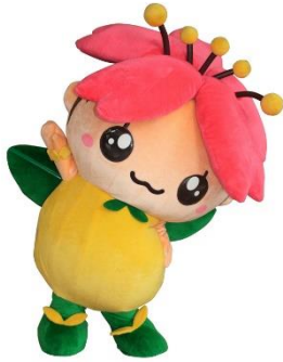
花のまちイメージキャラクター 「はなみちゃん」