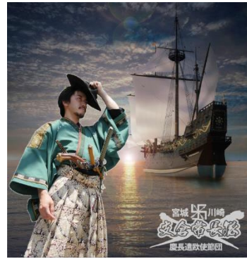
宮城県川崎町公式PR隊 「みやぎ川崎慶長遣欧使節団 支倉常長隊」