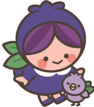
富谷市 「ブルベリッ娘とブルピヨ」